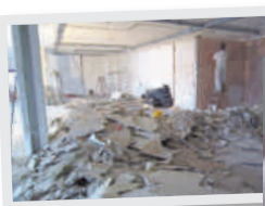
Heinrich-Schmid-Projekt Bürotage in Sindelfingen, vorher ...

Mehr Informationen und Teilnahmebedingungen unter www.hs-fotowettbewerb.de