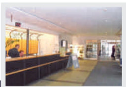
Heinrich-Schmid-Projekt Bürotage in Stuttgart, vorher ...

Nach dem tollen Erfolg des Fotowettbewerbs im Februar rufen wir Sie hiermit erneut dazu auf, die Kamera zu zücken. Alle HS-Mitarbeiter sind herzlich dazu eingeladen, ihre schönsten oder eindrucksvollsten Baustellen durch Vorher-Nachher-Bilder zu dokumentieren.