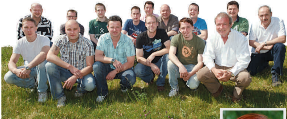
Auch der Trockenbaukurs 2011 traf sich zum Einführungstag in Allensbach am Bodensee.

Allensbach, Erfurt • Wer in Deutschland den Meistertitel im Maler- und Lackierhandwerk erlangen will, bereitet sich in der Regel auf Meisterschulen darauf vor. Doch welche Möglichkeit haben jene, welche aus finanziellen oder privaten Gründen nicht für ein halbes oder ganzes Jahr aus dem Berufsleben aussteigen können? Ihnen bietet die Führungsakademie zusammen mit der Online-Meisterschule eine interessante Alternative. Mit dabei: die Unternehmensgruppe Heinrich Schmid als Bildungspartner.